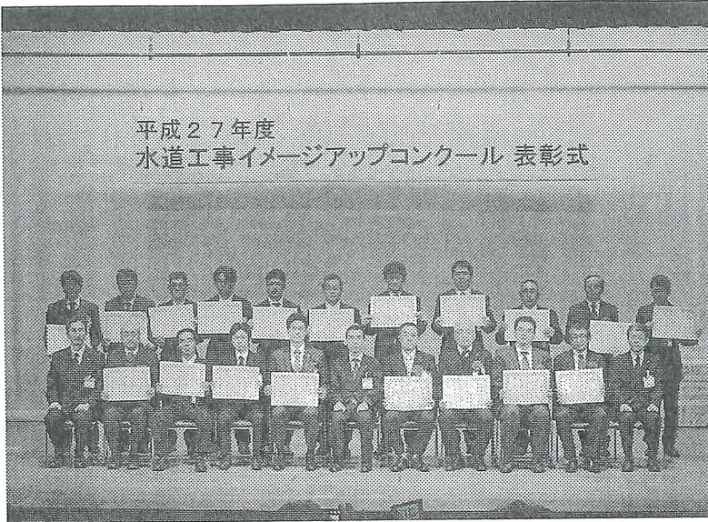
醍醐水道局長を囲んで記念撮影(角筈区民ホール)

いては、区部約件の実施が予定り、4月からのに向けて3月ト施組合員の募集る。 東京都都市整りまとめた平成における新設件計によると、前では、持家、分減少したが、管し、全体で3・11、801戸振りの増加とな利用関係別では前年同月比16の1、252戸振りの減少、20・0%増の6戸で7か月連続分譲住宅は同7の4、421戸連続の減少とな譲住宅の内訳はンが同11・6%